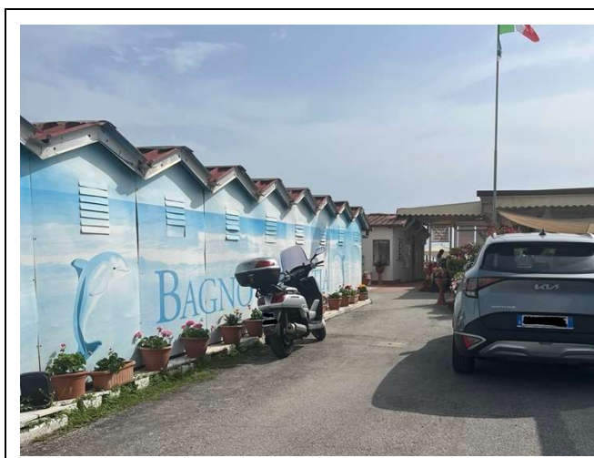
Ingresso stabilimento balneare